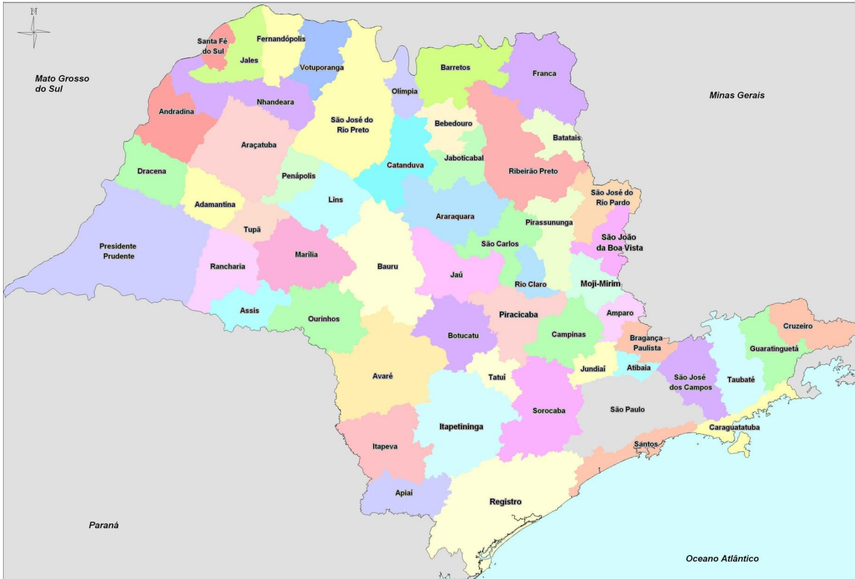
Figura 2 - Mapa das Áreas Polarizadas - 56 Polos de Atração