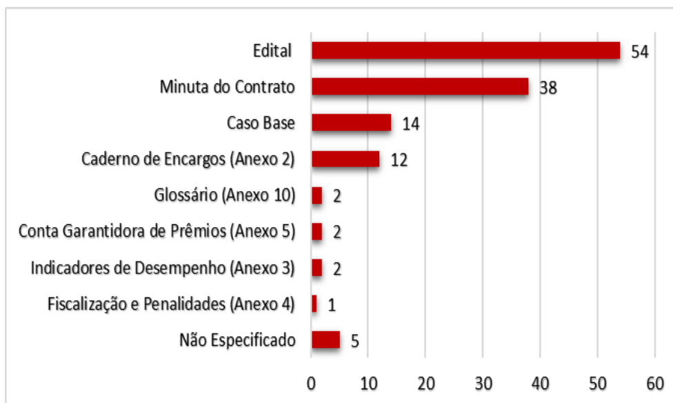
Figura 1 – Contribuições por Documento

Em relação aos temas que foram objeto de contribuições, com exceção aos ajustes formais que serão devidamente realizados nas versões finais dos documentos licitatórios, destacam-se os seguintes: (i) premissas utilizadas para elaboração do Caso Base e da Modelagem Econômico-Financeira; (ii) qualificação técnica e certificações; (iii) premissas utilizadas para definição do modelo de negócio; e (iv) premissas da Modelagem Jurídico-Institucional ( Figura 2 ).